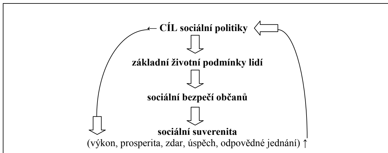
Graf č. 1: Sociální bezpečí a sociální suverenity

Sociální politika se rozvíjí v rámci celého společenského systému a také sama významně působí na jeho rozvoj. Vzájemná provázanost sfér života společnosti má za následek, že se sociální politika, její cíle, funkce a nástroje neutváří izolovaně, ale v souladu s těmito sférami a v souvislosti s řadou ekonomických, politických a mravních norem.